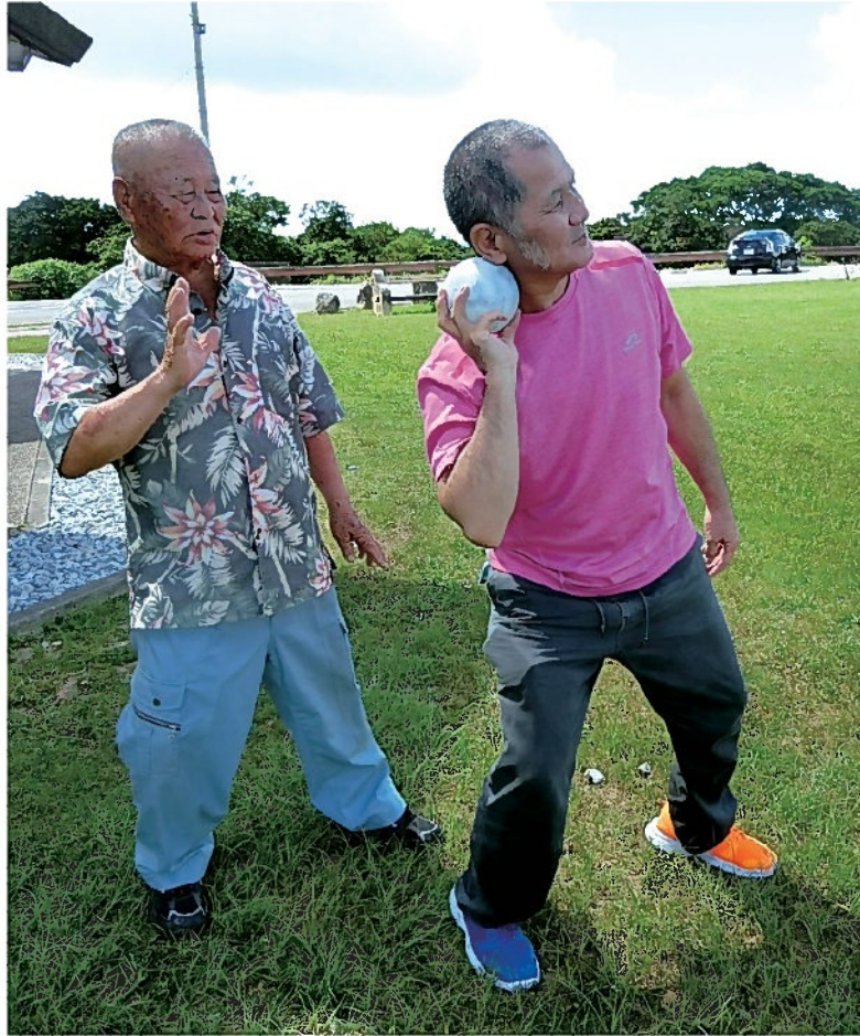
91歳の師匠（父）と共に