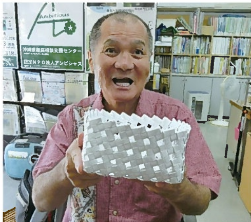
みんなに喜んでもらえる自信作の手作りの籠

うのを見て、「自分もできるかな」と思い連絡した。コロナが流行るちよつと前のことだった。