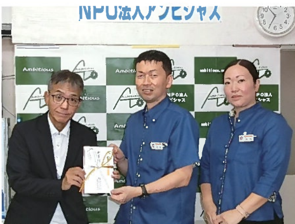
大央ハウジング様よりご寄付をいただきました。

創立34年を迎えられた株式会社大央ハウジング様、全保連株式会社様両社は、多年にわたって寄付を続けていただいています。通常の業務以外に社会貢献に向けている尊いご意志に心より感謝申し上げます。