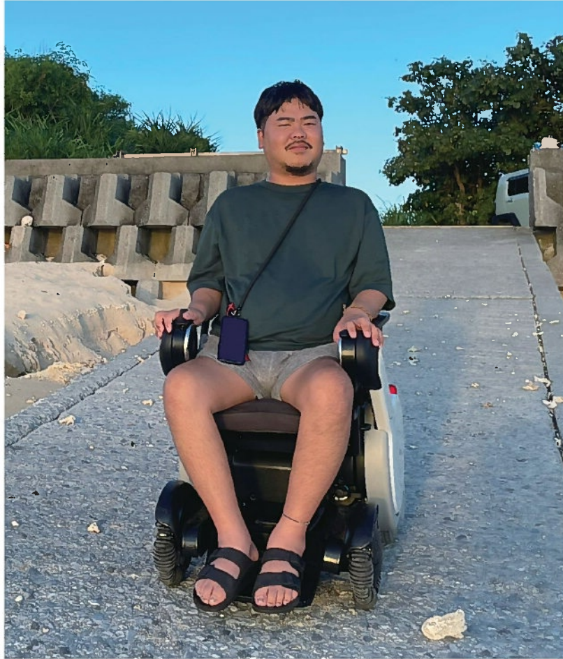
海へ夕口を眺めに

Q …発症はいつですか、どんな経緯で知りましたか？ A …一番最初に症状が出たのは、2021年の2月ごろ。右手の親指あたりに腱鞘炎のような、力の入りにくさがあった、コロナ禍や、病院