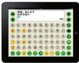
トーキングエイド

アンビシャスでは難病により人工呼吸器を装着され、ご自身の声で思いが伝えられなくなった方々の支援の一つとして、意思伝達装置やその関連機器の貸出事業を行っています。コミュニケーション支援機器の購入を検討するに当たり、その機器が使用者本人の身体状況と適合しているか、その機器を操作するスイッチは何かベストか等を購入前に実機で試すことにより、納得のいく機器の選択をサポートすることを目的としています。