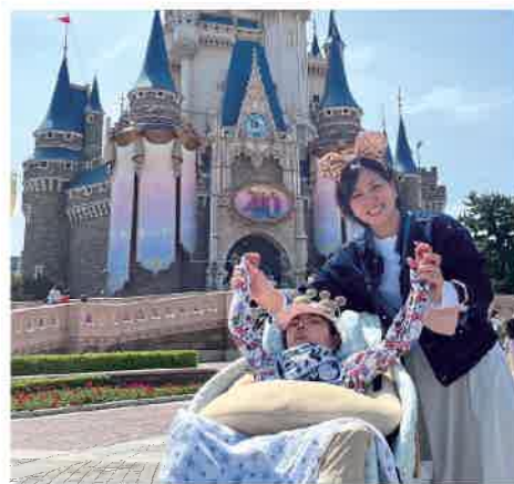
これからも2、3年に1度は旅行に行きたいです。

じです。本人の「あれがしたい!これがしたい!」というのは正直あまりないので、色々連れて行つて、反応を見ています。色々やってみて、何でもできるなつて思いました。ただ、気管切開をしているので海には潜れませんが、でもそれ以外はできると思つています。