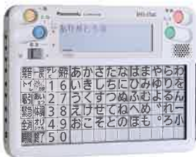
フラインチャット